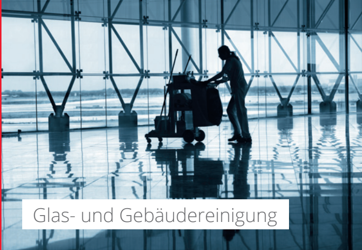
Glas- und Gebäudereinigung